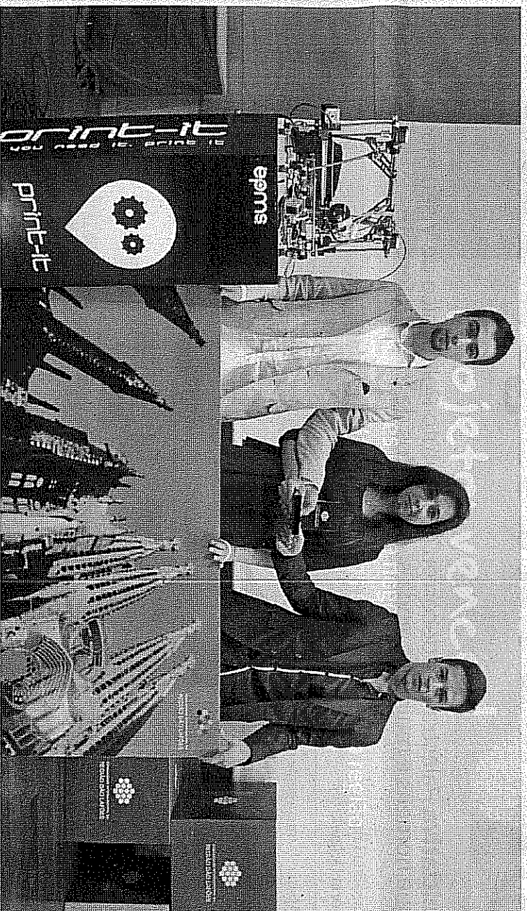
Volentis at odI ad ut omnibus eosmre es quia cusi, cond necte et volut utremas osmre es quia cusi, cond necte et

Adro Moda na Escadaria da Igreja dos Terceiros A Escadaria da Igreja dos Terceiros recebe, no dia 14 de Julho, mais uma edição do Adro Moda