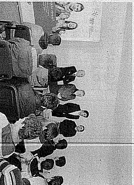
CIM aposta forte no empreendedorismo entre os jovens

Uma novidade para este ano será a realização de um campo de férias de empreendedorismo. Quatro dezenas de jovens, com idades compreendidas entre os 15 e os 18 anos, dos 14 municípios que integram a Comunidade Intermunicipal